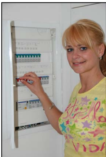
Obr.: Vypnutí hlavního jističe elektřiny

Při dlouhodobém opuštění domácnosti je Vaším nejdůležitějším úkolem si sbalit evakuační zavazadlo . Jak správně postupovat při balení evakuačního zavazadla a co má toto zavazadlo obsahovat, naleznete na dole uvedené webové stránce.