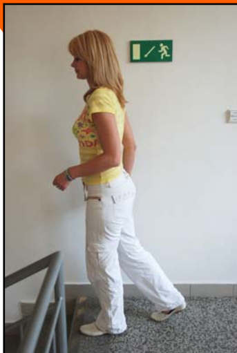
Obr.: Objektová evakuace

V případě vyhlášení evakuace, ať už se nacházíte doma, v kanceláři nebo nákupním středisku, je důležité vědět, co udělat před odchodem a jak se chovat při opuštění objektu. Hasičský záchranný sbor JmK ve spolupráci s Policií ČR – Městské ředitelství Brno a Diecézní charitou Brno Vám přináší základní informace o tom, jak v tomto případě postupovat a na co nezapomenout.