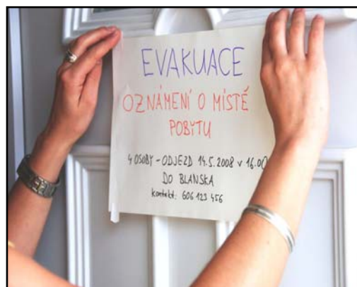
Obr.: Zpráva na vchodových dveřích

Mimo to ale při dlouhodobé evakuaci také vypněte i hlavní uzávěr plynu a vody (v případě povodně i elektřiny) a na vchodové dveře bytu umístěte zprávu o tom, kdo, kdy a kam se evakuoval a kontakt , na kterém budete k zastižení. Toto platí zejména pro případ, kdy hodláte pobývat mimo oficiální místa, určená k nouzovému ubytování evakuovaných (např. na své chatě, u příbuzných).